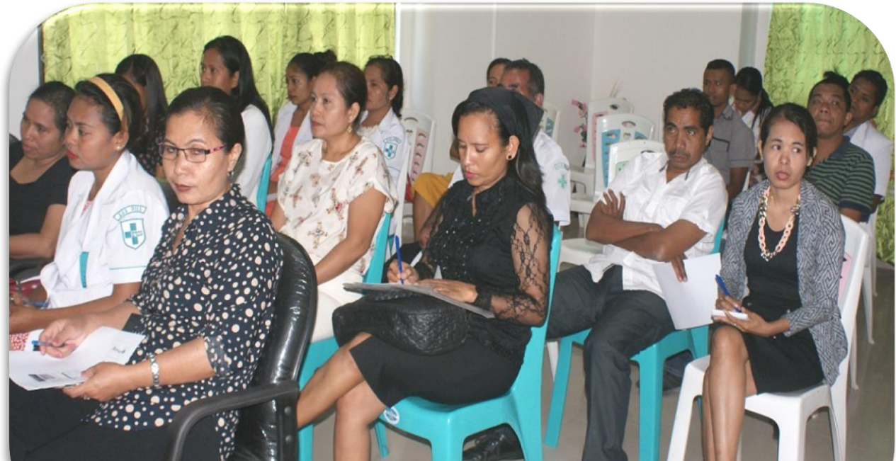
Funsionáriu Públiku husi Ministério Saúde, Partisipa enkontru publiku kona-ba Sistema Distribuisaun Aimoruk Iha Timor-Leste.

D ili- Provedoria dos Direitos Humanos e Justiça (PDHJ) Diresaun Governasaun Di'ak, Departamentu Prevensaun no Monitorizasaun hala'o Enkontru Publiku kona-ba "Sistema Distribuisuan Aimoruk Iha Timor-Leste", iha Servisu Saúde Munisipiu Dili, ne'ebé realiza iha loron 6 fulan Juñu 2016.