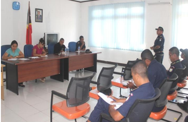
Ekipa PDHJ lidera husi Adjuntu Provedor Direitus Umanus realiza enkontru públiku ho membrus PNTL sira hodi rekolha tan pontu-pontus adisional molok atu publika rezultadu monitorizasaun kona-ba sela detensaun polisia iha territoria laran.